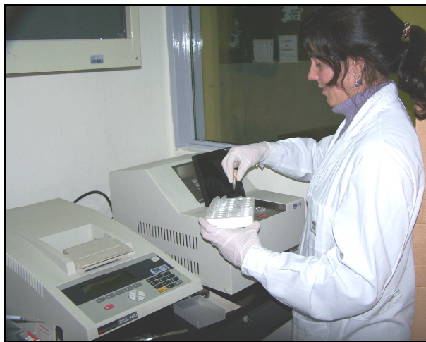
(Fig.-6) Análisis por PCR