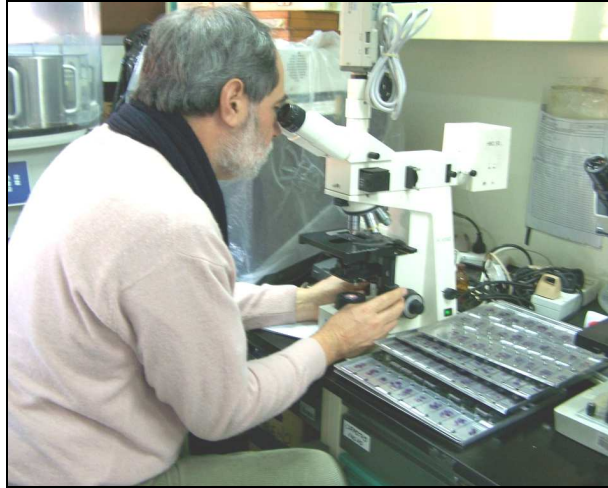
(Fig.-5) Análisis Histopatológico