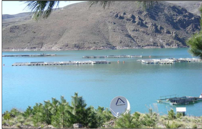
(Fig.-1) Jaulas de cultivo de Trucha Arco Iris en el embalse Alicurá