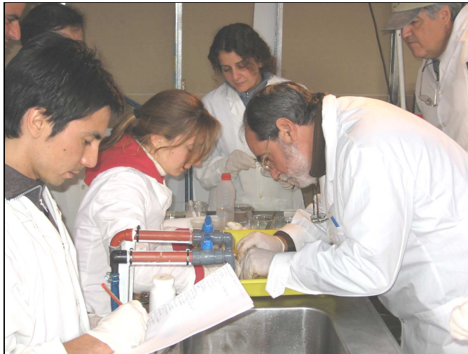
(Fig.-2) Capacitación de agentes de las diferentes instituciones participantes (SENASA, CEAN, INIDEP, Prov. De Río Negro y Neuquén)